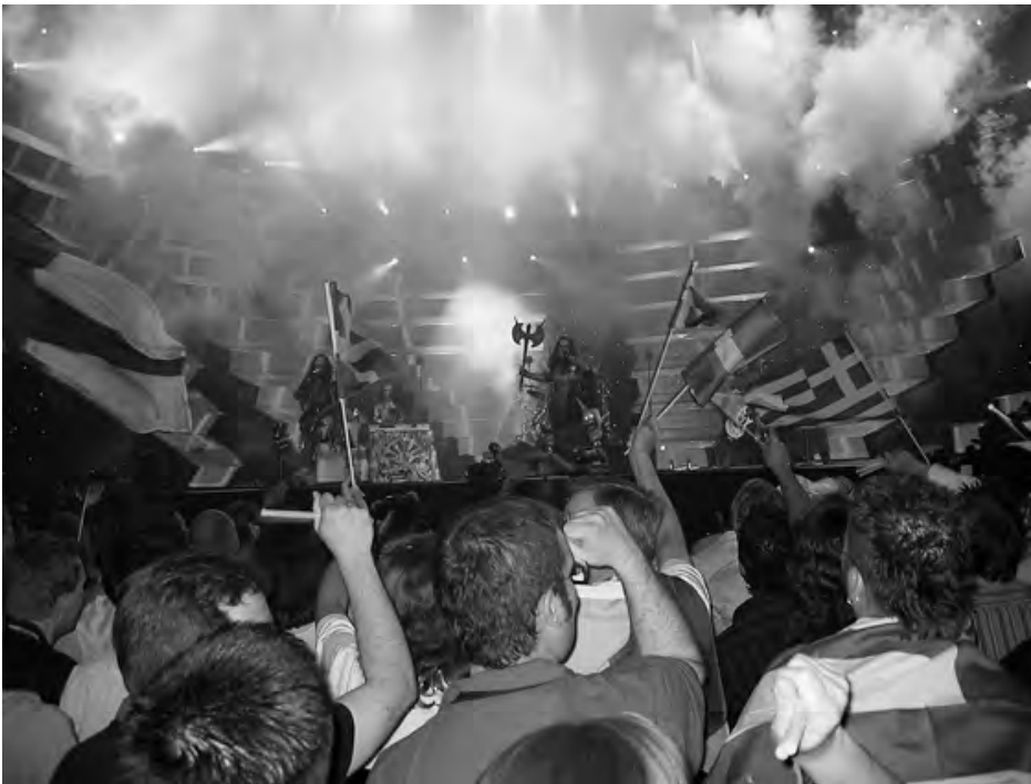
Abb. 8: Die Tickets für das Parkett vor der Bühne mit den Stehplätzen in den ESC-Hallen werden seit vielen Jahren an die ESC-Fan-Community verkauft: Sie werden damit auch zu Kamerafutter – alle möglichen Fahnen der ESC-Länder schwenkend, auch die Regenbogenflagge, Symbol der globalen Queer-Community.

Der Eurovision Song Contest, zumal mit der Teilnahme Australiens seit 2015, 72 ist mit seinen schwulen, queeren Fans zu einem Faktor der politischen Erhitzung über Europa hinaus geworden. 2014 beim ESC in Kopenhagen wurden die Tolmatschewa-Zwillinge aus Russland bei ihrer Darbietung hörbar ausgebuht – es war ein Protest gegen die Politik Wladimir Putins. Und zur Gala-Show aus Anlass des 60. Geburtstags des ESC, am 31. März 2015 in London, wurde eine Reihe von Eurovisionsveteranen eingeladen – unter ihnen der russische ESC-Sieger von 2009, Dima Bilan. Das Publikum buhte ihn bei seiner Performance aus – aus Kritik an den antihomosexuellen Gesetzen in Bilans Heimat. Die EBU, die die nicht live gesendete Show nicht in alle Eurovisionsländer übertrug, konnte die Sendelizenz nach Russland nur unter der Bedingung verkaufen, dass die