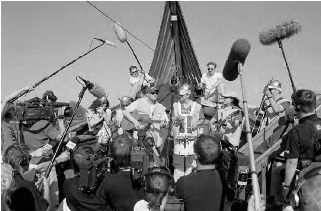
Abb. 6: Stefan Raab, der heterosexuelle ESC-Nerd schlechthin, wenige Tage vor seinem Solo-Auftritt im Jahre 2000 in Stockholm, bei einer Presseausfahrt auf einer Kogge: ein Bad in der Öffentlichkeit, umkränzt von Mikrofongalgen

Andere Länder sind in dieser Hinsicht offener gesinnt. 67 Der erste LGBTI*-Stadtplan für ESC-Touristen mit für diese besonders interessanten Punkten wurde 2007 von der ESC-gastgebenden Stadt Helsinki ausgegeben; die schwedische Gastgeberrolle 2015 in Stockholm bot in den Showteilen zwischen den Liedern auch ein offen schwul agierendes Männerpaar auf – die Moderator*innen Petra Mede und Måns Zelmerlöw machten in ihren Moderationstexten daraus auch kein Geheimnis. Inklusion, der Respekt vor der moralischen Agenda der Diversität von Publikum und Teilnehmenden, gilt faktisch dort als ein Charakteristikum des ESC. Dass es auch anders gehen kann, bewies die ESC-Stadt Moskau 2009, als der Bürgermeister zum Eröffnungsempfang nicht kommen wollte, weil ihm dort zu viele Schwule herumliefen. Als russische Aktivist*innen am Tag des ESC-Finales einen kleinen CSD-Umzug veranstalten wollten, wurde dieser, kaum versammelt, von russischen Milizionären und