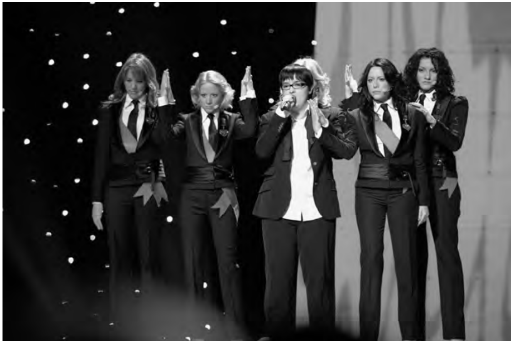
Abb. 5: Marija Šerifović, Siegerin des ESC 2007, mit ihren fünf Choristinnen

sonst nur in männlichen Performances gewohnt war, als signalisierten sie nämlich »She never walks alone«, eine für alle, alle für eine.