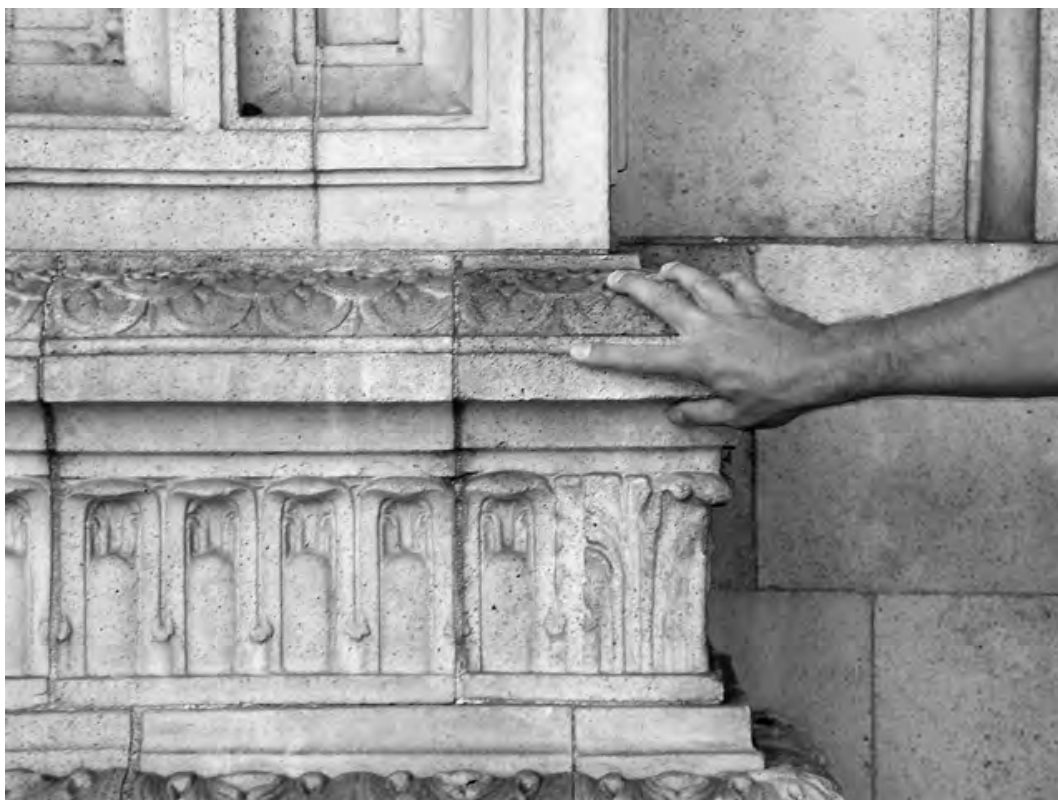
Abb. 3: Einmal die Royal Albert Hall in London berühren, den Palast, in dem 1968 ein ESC stattfand, bei dem der Star der britischen Musikindustrie, Cliff Richard, nicht gewann – und in dem die Norwegerin Wencke Myhre als deutscher ESC-Act mit »Ein Hoch der Liebe« versuchte, dem eurovisionären Ausland zu signalisieren, dass Deutschland ganz lieb geworden sei. Viele ESC-Fans besuchen sommers die einstigen Arenen des ESC – religiöse Berührungshandlungen wie auf einer Pilgerfahrt.

ESC-Kandidat*innen – die eurovisionäre Show ebenfalls nutzend, um international bekannter zu werden. Ein italienischer Teenagerstar wie Gigliola Cinquetti gewann 1964 mit einer Ballade zunächst in San Remo, ehe sie beim ESC in Kopenhagen siegte – und über ihr Heimatland hinaus zu einer bekannten Sängerin wurde. Sie produzierte ihr Lied »Non ho l'età (per amarti)« auch auf Spanisch, Englisch, Französisch, Englisch und Japanisch – wie so viele ESC-Erfolgskünstler*innen vor und nach ihr. 31 Die