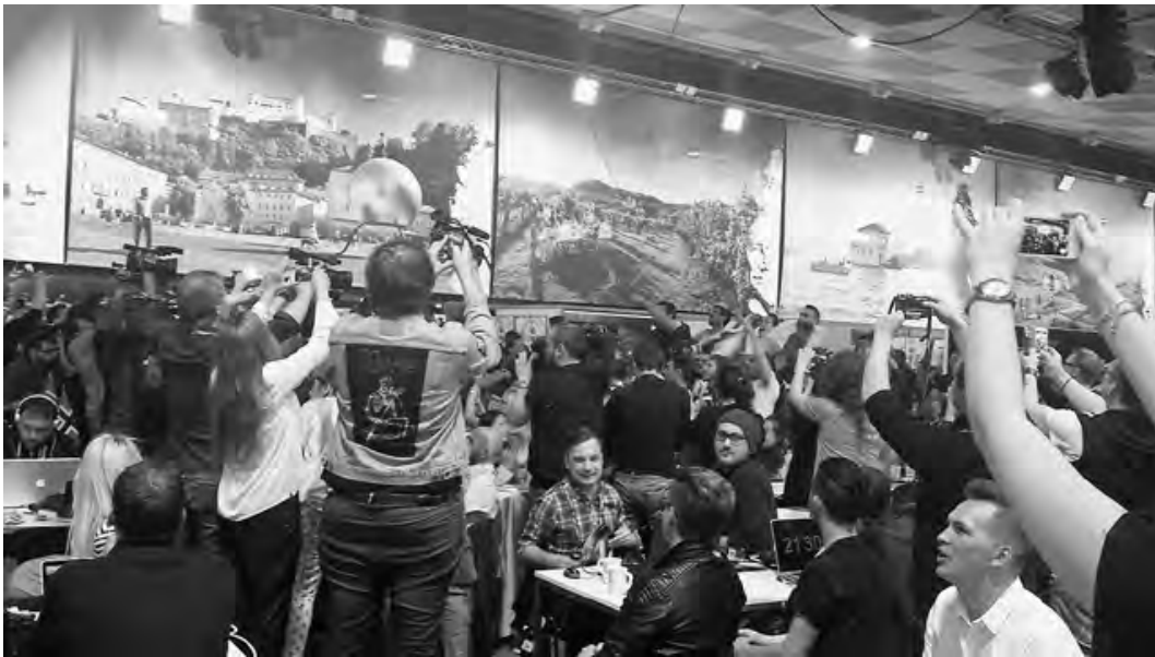
Abb. 4: Bis zu 2.000 Journalist*innen und Fans in einem ESC-Medienzentrum: Arbeiten am Werk der europäischen Verständigung, über alle Grenzen hinweg

durch die Punktwertungen. Exegesen durch Fans nach einem ESC gehören dazu; das Durchspielen von Situationen, die sich in Punkten und Rängen ausdrücken, nach einem Ereignis, ist offenkundig. Woran das liegt, worin diese Dichotomie in den Prägungen und Identitätskonstruktionen von Geschlechtern begründet liegt, ist ungeklärt – sicher ist nur, dass es sie in Dichte gibt.