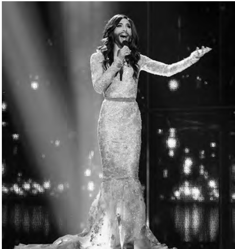
Abb. 2: Conchita Wurst, der unwahrscheinlichste ESC-Sieg überhaupt: ein schwuler Mann, der als Drag Queen das eurovisionäre Publikum betört und durch künstlerische Leistung überzeugt

In Russland, wo Ende der nuller Jahre dieses Jahrhunderts ein Gesetz zur Strafbarkeit homosexueller Öffentlichkeiten verabschiedet wurde, wie in anderen postsozialistischen Ländern wurde Conchita Wursts Sieg weitgehend als Sieg westlich-europäischer Dekadenz begriffen und kritisiert – obwohl bei der Punktwertung der österreichische Beitrag erheblich Zustimmung seitens des televotenden Publikums erhalten hatte, auch aus Ländern wie Russland und anderen, die nicht gerade für eine libertär aufgeblühte und anerkannte Queer Culture stehen. Für das türkische Fernsehen TRT, seit seiner Islamisierung nicht mehr beim ESC dabei, war Conchita Wurst schlechthin ein weiterer Beleg für die Richtigkeit der Ent-