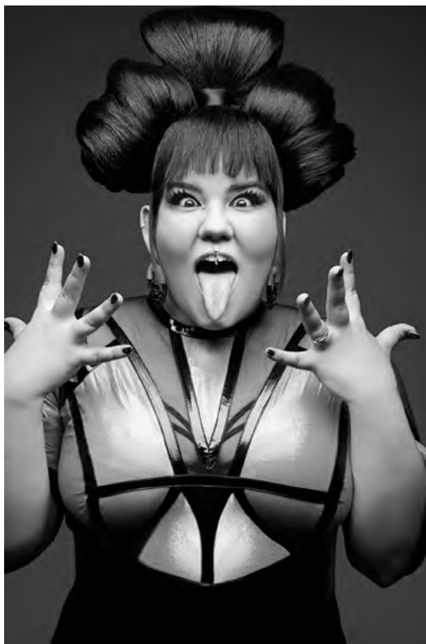
Abb. 7: Netta Barzilai, die für Israel den vierten ESC-Gewinn realisierte. Ihr Titel »Toy« war das Statement zur #metoo-Debatte: niemandes Spielzeug sein zu wollen, sich aggressiver Attacken souverän erwehrend.